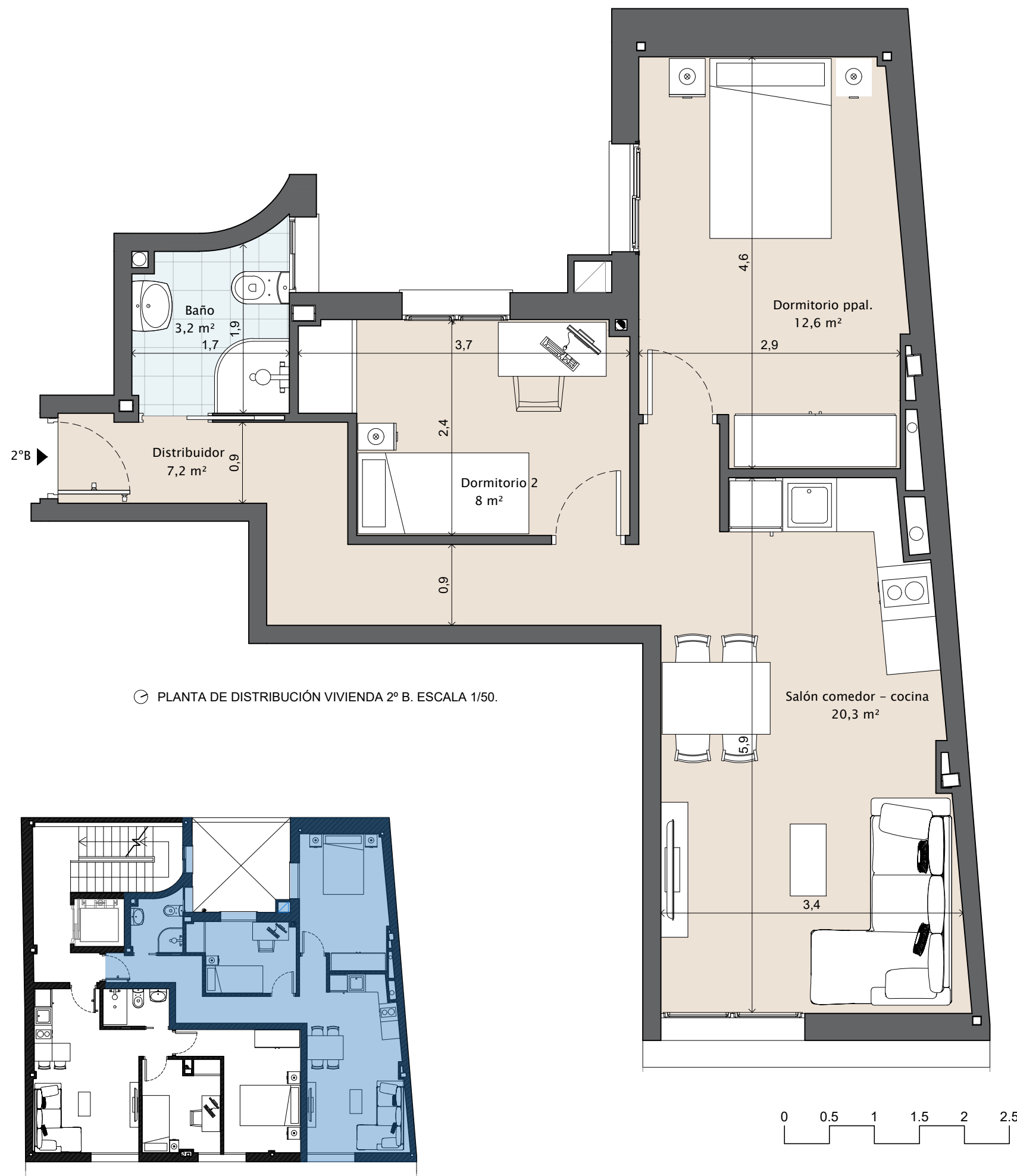
PLANTA DE DISTRIBUCIÓN VIVIENDA 2° B. ESCALA 1/50.