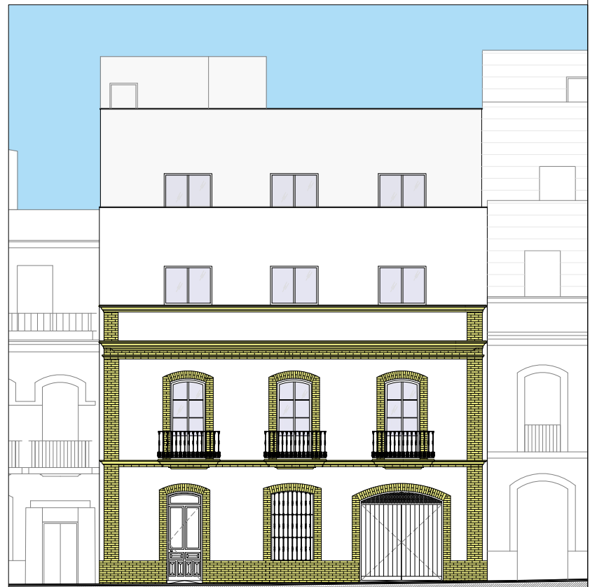
PROMOCIÓN DE 4 VIVIENDAS Y GARAJES EN CALLE ALFONSO XII, Nº 4 (HUELVA)